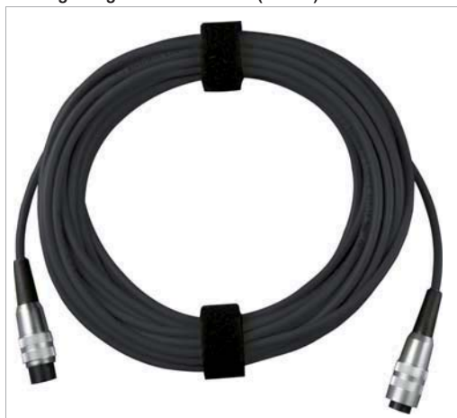
Verlängerungskabel für Pt100 (Z360E)