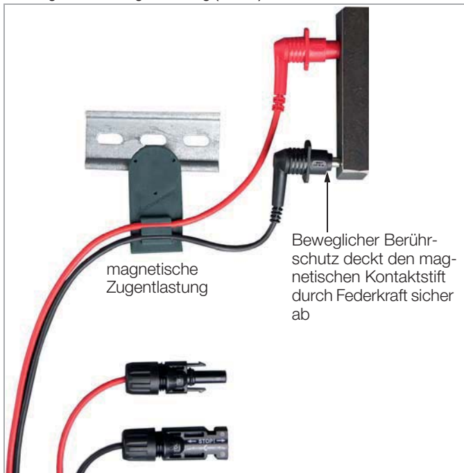
Magnetische Messspitzen (Patent) mit magnetischer Zugentlastung (Z502Y)