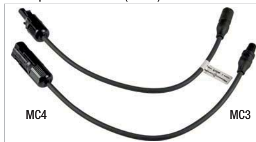
PV-Adapterset MC3-MC4 (Z360K)