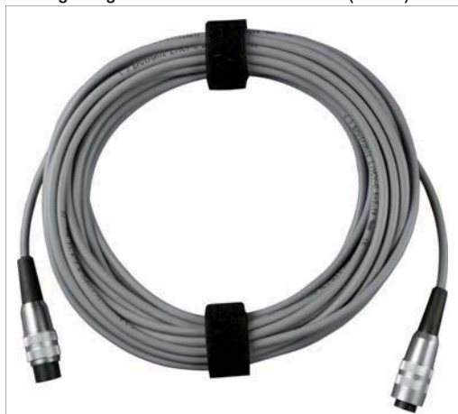
Verlängerungskabel für Referenz-Sensor (Z360F)