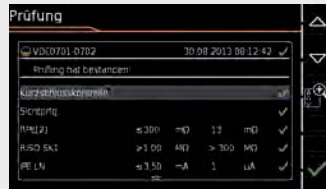
KLARE DARSTELLUNG Prüfergebnis eines Prüfungsablaufs